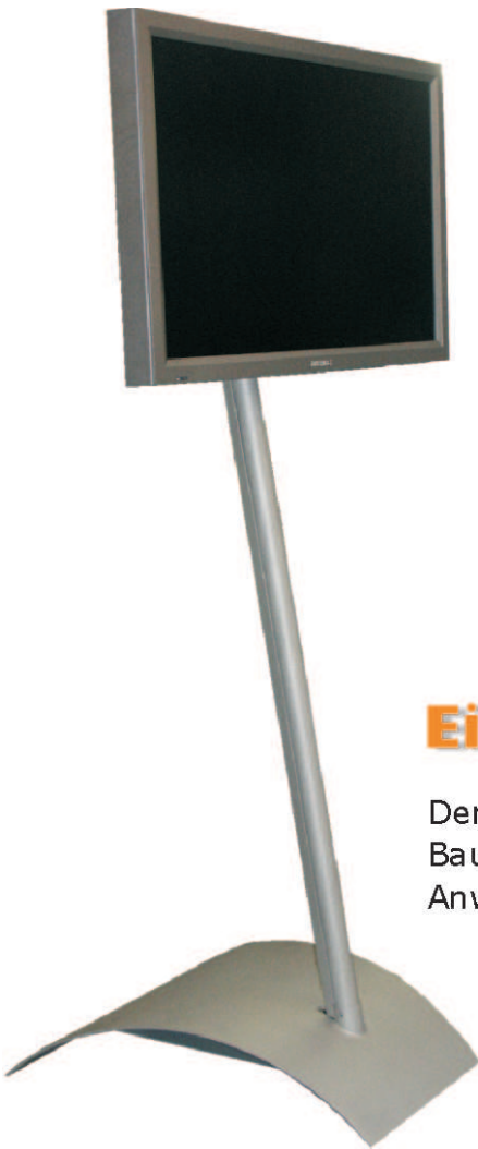
Abb.: WaveMaster mit 42" Bildschirm. Vertikal montiert.

Bis 42" Bildschirmgröße ist auch eine horizontale Montage möglich.