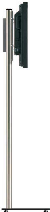
Schlank, schlicht... ... BasicStand!