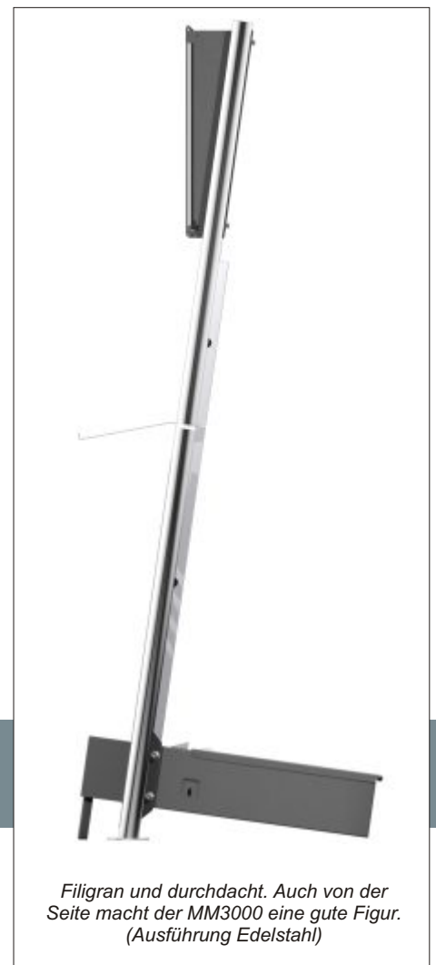
Filigran und durchdacht. Auch von der Seite macht der MM3000 eine gute Figur. (Ausführung Edelstahl)