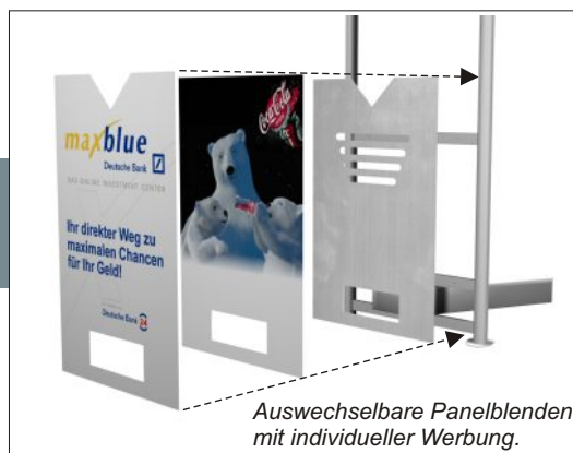
Auswechselbare Panelblenden mit individueller Werbung.