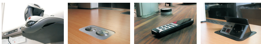
Kamerahalterung Integr. Hubsteuerung IR-Fernbedienung Anschlussfelder

Die vollständige Optionsliste entnehmen Sie bitte dem Extrapropekt "MediaLift System - Optionen"