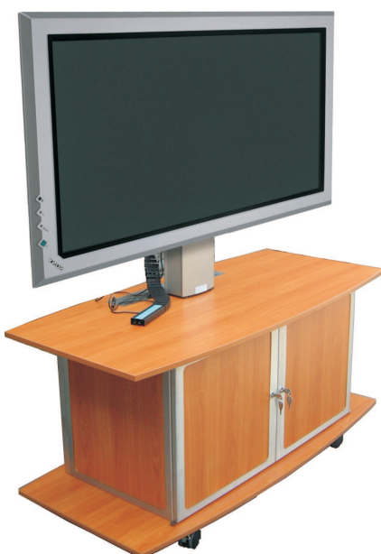
Abb.: MediaLift Business in Oberfläche Kirschbaum und 50" Bildschirm.

Das MediaLift System ist in vier Varianten erhältlich. Diese unterscheiden sich im wesentlichen in der Ausstattung und der Anzahl der möglichen Dekore und Oberflächen.